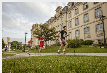
Lycée Gay Lussac