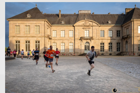
Jardin de l'évêché

L'Urban Trail Limoges est l'occasion idéale pour votre entreprise de s'associer au dynamisme du territoire et de partager un moment convivial autour du sport local. Accélérez et développez vos relations avec nos partenaires tout en participant à un événement qui célèbre l'énergie, la proximité et l'engagement local.